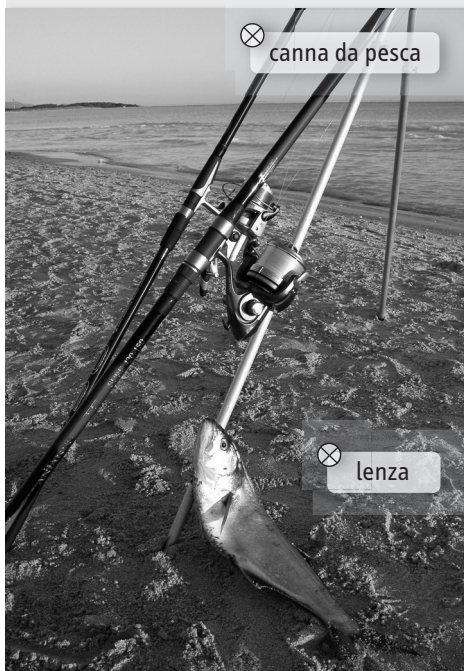
⊗ canna da pesca