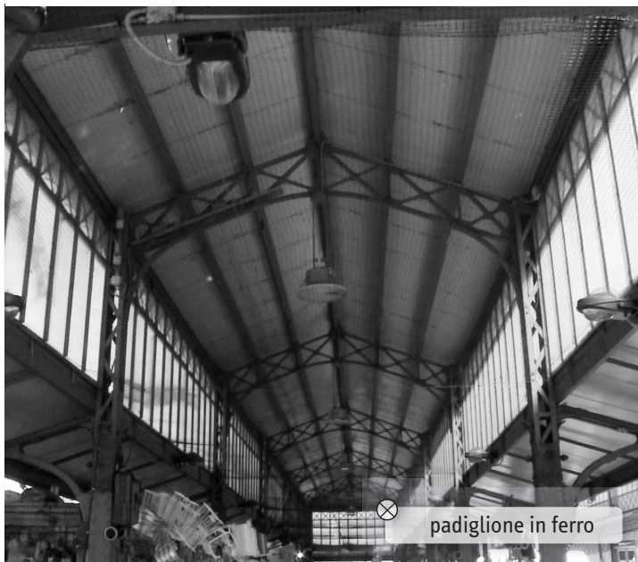
padiglione in ferro