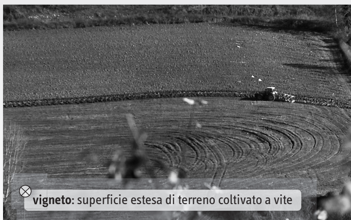
⊗ vigneto: superficie estesa di terreno coltivato a vite