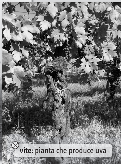
⊗ vite: pianta che produce uva