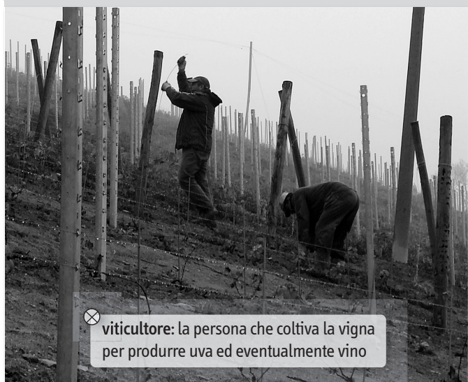
⊗ viticoltore: la persona che coltiva la vigna per produrre uva ed eventualmente vino

Siamo nelle Langhe, una zona di campagna del Piemonte. Il paesaggio è fatto di colline, boschi e vaste zone agricole. Qui s'incontrano paesi, chiese e castelli con una storia molto antica. La tradizione contadina è ancora molto viva e il rapporto tra la terra e i suoi abitanti ha dato come esito nocchie prelibate e vini preziosi esportati in tutto il mondo.