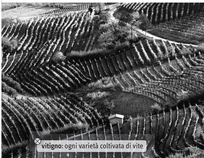
⊗ vitigno: ogni varietà coltivata di vite