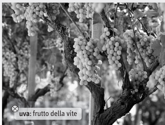
⊗ uva: frutto della vite