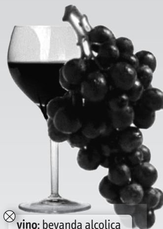
⊗ vino: bevanda alcolica ottenuta dalla fermentazione dell'uva