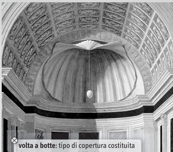
⊗ volta a botte: tipo di copertura costituita da una struttura semicilindrica poggianti su due muri paralleli