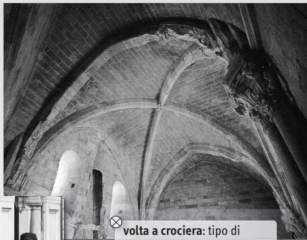
⊗ volta a crociera: tipo di copertura formata dall'intersezione di due volte a botte perpendicolari

I confini architettonici di una piazza sono le strade e gli edifici che la circondano, ma dal punto di vista umano essa non ha confini né frontiere perché è sempre un punto di passaggio e breve sosta di cittadini e turisti provenienti da tutte le parti del mondo. Ad attrarre i turisti sono principalmente i monumenti, le fontane e gli edifici di valore artistico che si concentrano nella maggior parte delle piazze italiane.