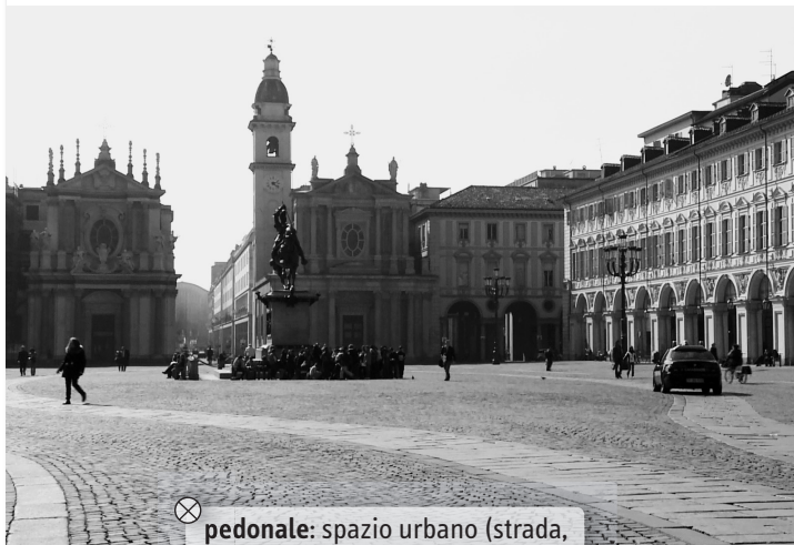
⊗ pedonale: spazio urbano (strada, piazza ecc.) riservato ai pedoni