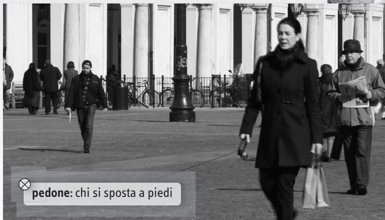
⊗ pedone: chi si sposta a piedi

Sin dall'antichità classica la piazza (agorà) è un luogo molto importante per tutte le civiltà mediterranee. Lo spazio della piazza in Italia è quello degli eventi quotidiani e degli episodi storici. È uno spazio comune, spesso un "salotto cittadino", un luogo in cui incontrare altre persone e ascoltare loro storie.