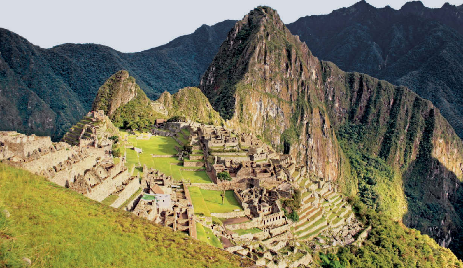
▲ Machu Picchu, Perú.

murallas, acueductos, y sobre todo puentes y caminos andinos 13 que facilitaban las comunicaciones en un imperio tan vasto. El símbolo inca más famoso en el mundo es el pueblo andino de Machu Picchu, construido a mediados del siglo XV en la cordillera central de Perú. El centro y capital del imperio era, sin embargo, la ciudad de Cuzco (“el ombligo 14 del mundo”). Hoy en día se pueden reconocer fácilmente las antiguas construcciones incas aunque sobre ellas los españoles levantaron sus edificios religiosos o civiles de la época colonial. La decadencia del imperio inca se inició con la guerra por el poder entre los dos hermanos Huáscar y Atahualpa, así que fue fácil presa de los conquistadores españoles, encabezados por Francisco Pizarro.