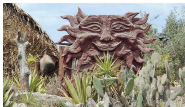
▲ Estatua monolítica inca, Ecuador.

murallas, acueductos, y sobre todo puentes y caminos andinos 13 que facilitaban las comunicaciones en un imperio tan vasto. El símbolo inca más famoso en el mundo es el pueblo andino de Machu Picchu, construido a mediados del siglo XV en la cordillera central de Perú. El centro y capital del imperio era, sin embargo, la ciudad de Cuzco (“el ombligo 14 del mundo”). Hoy en día se pueden reconocer fácilmente las antiguas construcciones incas aunque sobre ellas los españoles levantaron sus edificios religiosos o civiles de la época colonial. La decadencia del imperio inca se inició con la guerra por el poder entre los dos hermanos Huáscar y Atahualpa, así que fue fácil presa de los conquistadores españoles, encabezados por Francisco Pizarro.