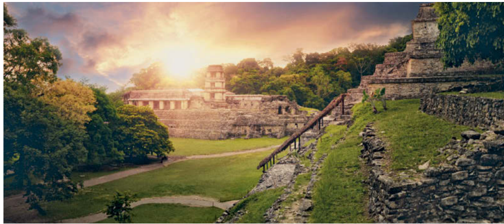
▲ Palenque, México.

Este juego no tenía un significado lúdico, era más bien un juego religioso y mortal: el partido podía terminar con la ejecución del perdedor.