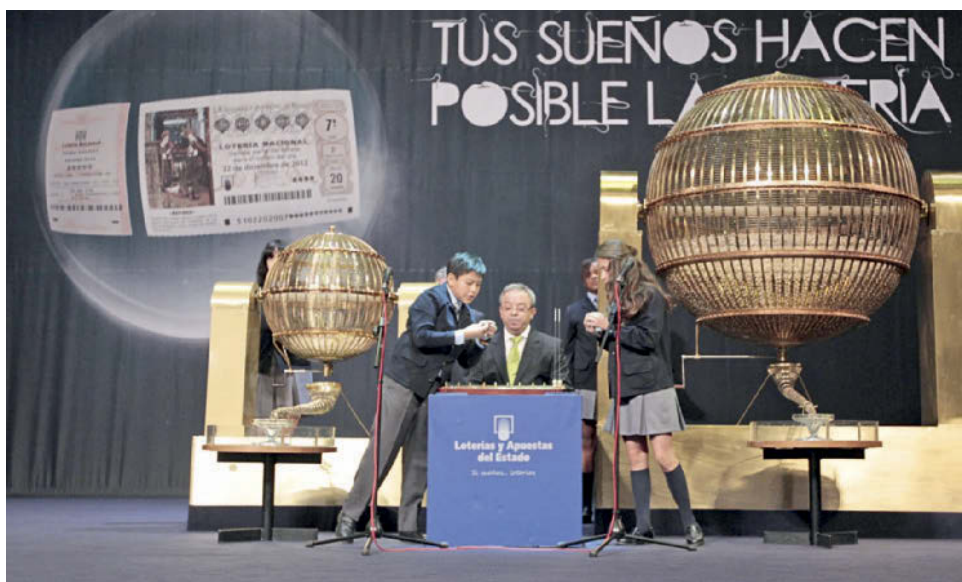
▲ El sorteo de la lotería de Navidad.

El día 22 de diciembre es muy importante porque empiezan tanto las vacaciones en las escuelas como las celebraciones navideñas. Se realiza el sorteo de la Lotería de Navidad y el país se paraliza para escuchar en la televisión los números de la lotería, cantados por los alumnos de la escuela San Ildefonso de Madrid. Este sorteo se realiza desde 1763. El primer premio se llama el Gordo.