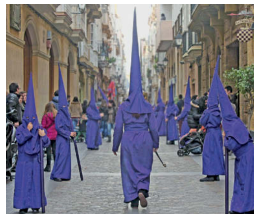
▲ Los nazarenos desfilan por las calles de Sevilla.

En Andalucía y en la Región de Murcia es diferente: prevalecen la luz, el color y el sonido. Mujeres, hombres y niños, llamados nazarenos, cantan con voz trágica desde los balcones y las aceras 4 . La música de los tambores se mezcla con el colorido de las flores y de los vestidos típicos de la fiesta.