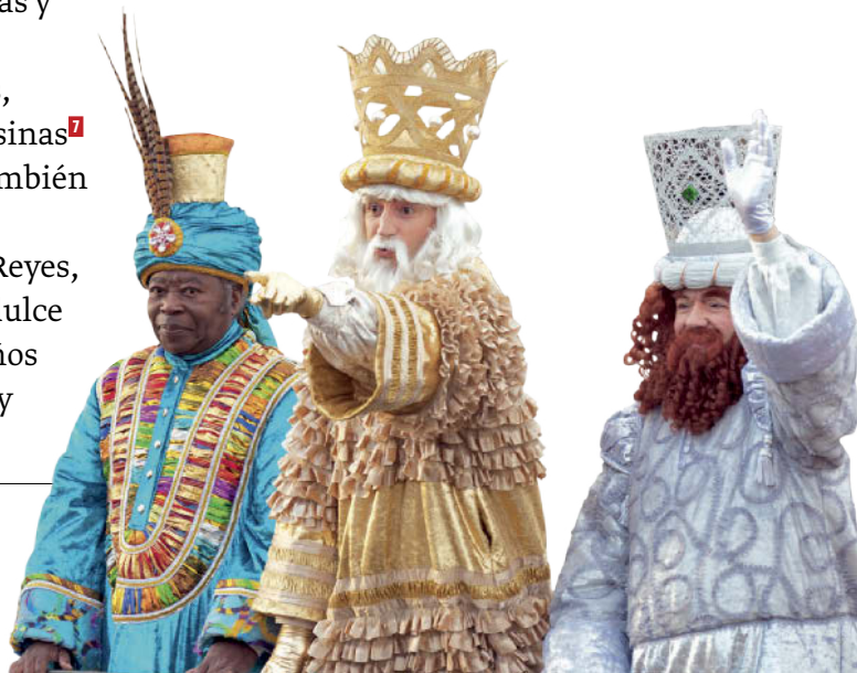
▲ Los Reyes Magos: Melchor, Gaspar, Baltasar.