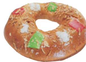
▲ El roscón de Reyes.

El dulce típico de ese día es el roscón de Reyes, relleno de nata, crema o mazapán. Este dulce contiene sorpresas que descubren los niños al comerlo y quien las encuentra es el Rey o la Reina del día.