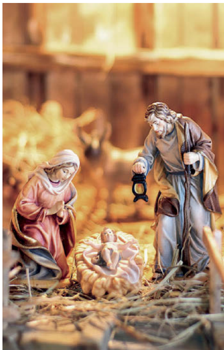
▲ El belén navideño.

El 24 de diciembre, Nochebuena, se cena en familia y todos cantan villancicos. Antes, el pavo relleno era el plato principal de la cena, pero hoy en cada comunidad autónoma hay diferentes tipos de comida. Después se brinda con champán o cava 1 y se comen