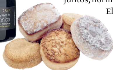
▲ El cava y los mazapanes.