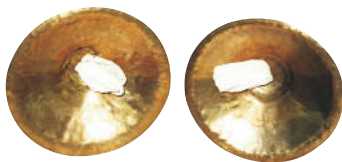
Cimbali o crotali