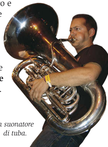
► Un suonatore di tuba.

Oltre al basso tuba, esistono altri tipi di flicorni quali il flicorno soprano , dall'estensione simile a quella della tromba, il contralto e il tenore o baritono , detto anche bombardino . I flicorni sono usati nelle bande e nelle fanfare , mai in orchestra.